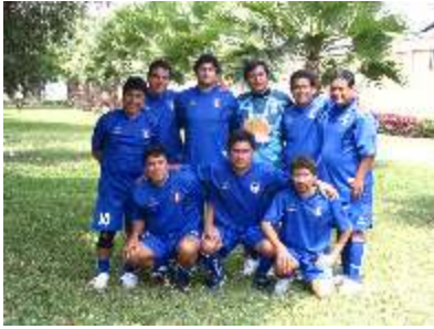
Equipo de la Universidad Nacional de Trujillo

El sábado 10 de Marzo se realizó la final del “VIII Campeonato Nacional de Confraternidad Interuniversitario de Fútbol Docentes” organizado por la ADUNI, en este campeonato participaron docentes de las principales universidades de Lima y de provincia, siendo el campeón el equipo de la Universidad Nacional de Trujillo.